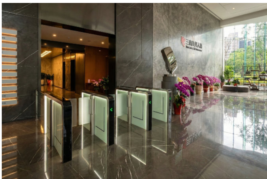
美商三商美邦人壽總部大樓